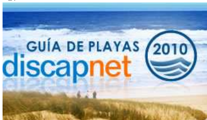
FIGURA N° 2: